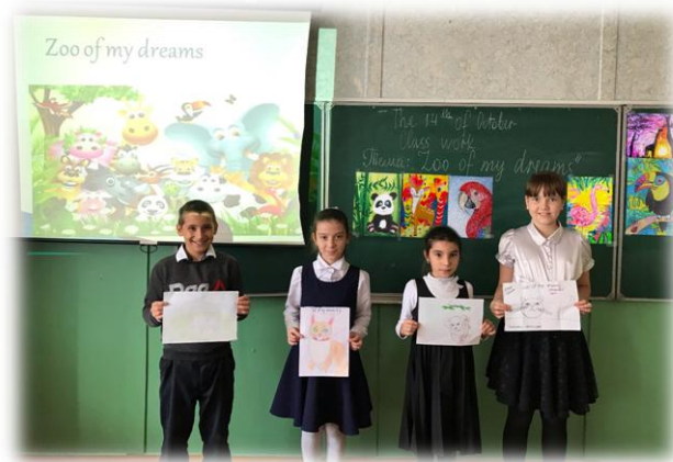
Урок-Презентация «В стране Past Simple» для 4 кл.