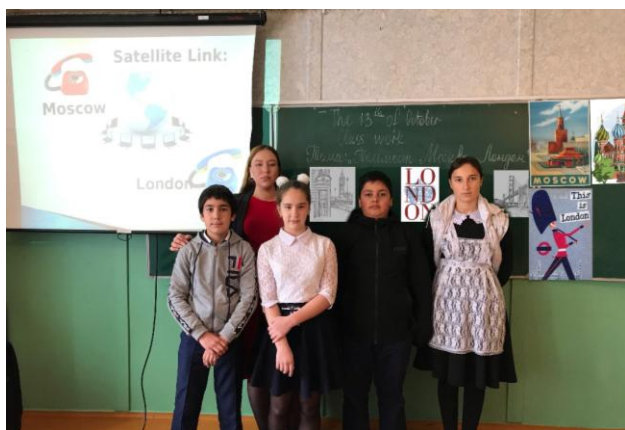
Конкурс творческих проектов «Зоопарк моей мечты» для 5 класса .

Телемост «Москва- Лондон» для учащихся 7 класса .